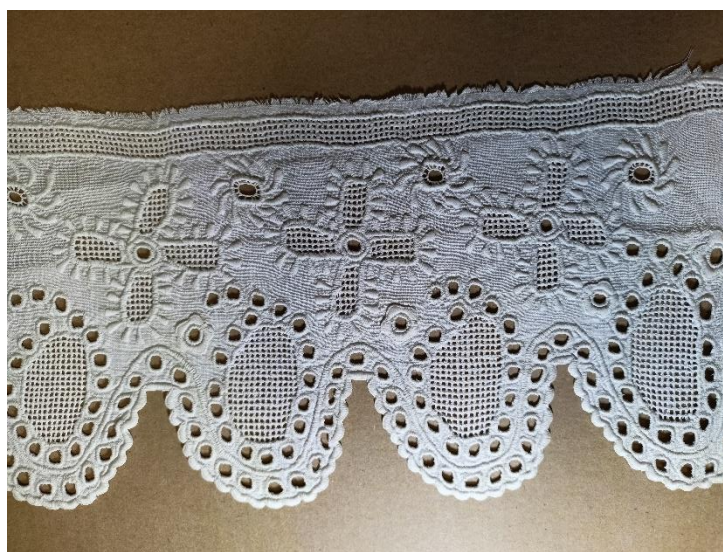
Fotografia 3. Misternie zdobiony mankiet rękawa koszuli kobiecej wykonany w Witowie w 1932 r. E/4451a/MT – tkanina wycięta w zęby ozdobiona podwójnym rzędem dziurek. Większe otwory wypełnione gęstą siatką. Wzór wzbogacony o dekorowane siatką i haftem płaskim motywy kwiatowe i motywy wirującego słońca.