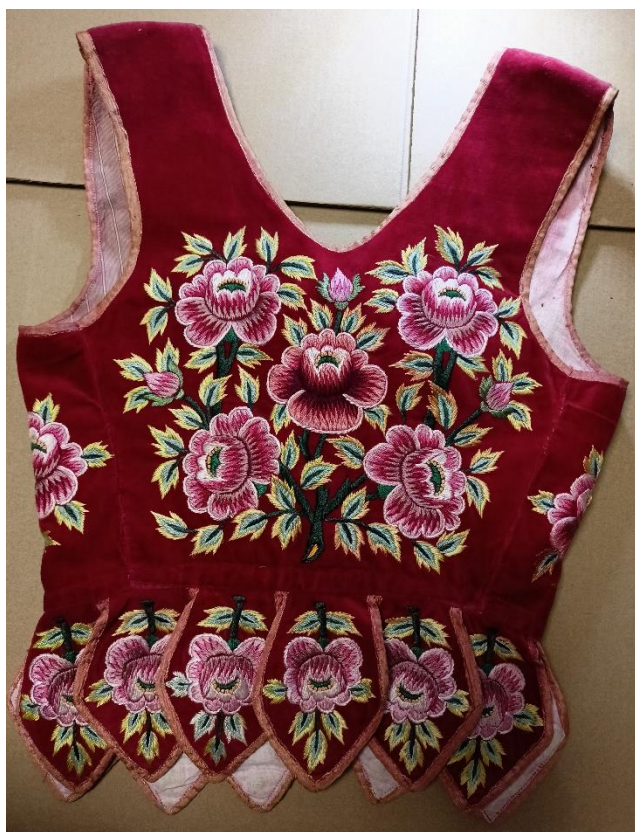
Fotografia 40. Gorset z czerwonego aksamitu wyhaftowany nićmi w róże. Haft cieniowany w różne odcienie różu, żółci i zieleni. Gorset wykonany w latach 1970-75 przez Agatę Fiedor z Cichego. E/ 8726/MT.

Inną formą zdobień na gorsetach były hafty wykonywane kolorowymi nićmi, kordonkiem, muliną lub nićmi jedwabnymi. W tym typie zdobień stosowano takie same motywy zdobnicze jak wymienione powyżej kompozycje z kwiatów i roślin górskich lub ogrodowych. Posługiwanie się haftem płaskim, miało wielki wpływ na sztukę zdobnictwa gorsetów, bowiem najlepsze hafciarki nakładając kolejne warstwy nici i stosując tzw. cieniowanie, gdzie dwa lub trzy kolory zbliżone odcieniami nachodzą na siebie, uzyskiwały efekt haftu trójwymiarowego.