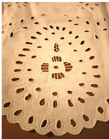
Fotografia 9. Motyw tzw. „gruski” z dwoma rzędami dziurek i motywem kwiatowym w środku, motyw stanowi dolną dekorację kobiecej halki, fot. ze zbiorów autora tekstu.