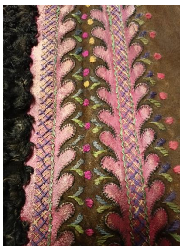
Fotografia 33. Detal zdobienia serdaka męskiego. podwójna aplikacja z safianowej skórki, wycięta w zęby, ozdobiona po wierzchu haftem krzyżkowym tzw. krokiewką lub ścięciem zakopiańskim, w kolorach żółtym i fioletowym, obrysowaną cyroniem czyli skórzanym rzemykiem w kolorze jasnej zieleni. Na zewnątrz aplikacji hafty roślinne ścięciem płaskim – listki i tzw. bulki. E/1676/MT.