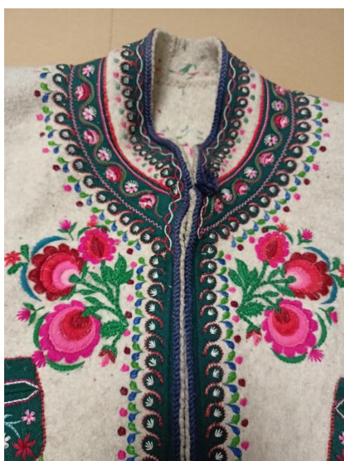
Fotografia 26. Cucha z sukna białego ozdobiona haftowanymi bukietami z motywem pawiego oka E/3133/MT