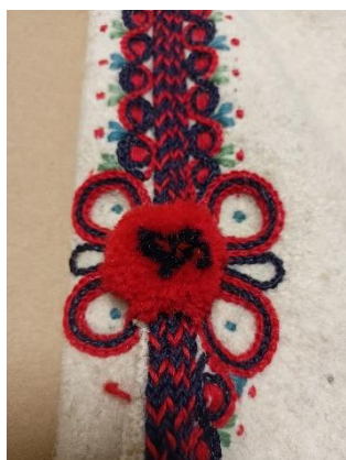
Fotografia 15. Ozdobna „kistka” czyli pompon z czarnej i czerwonej wełny z okalającym go haftem w formie pętli, wykonanych ścięciem łańcuszkowym, E/293/MT.