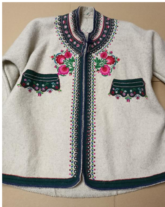
Fotografia 22. Cucha z białego sukna wykonana w 1935 r. przez Stanisława Fatłę ojca z Kościelisk dla muzeum Tatrzańskiego w Zakopanem E/3133/MT.

Pierwsze zdobienia białych cuchach, czyli okryciach wierzchnich wykonanych z białego sukna, pojawiły się w XIX wieku. Zdobila ją kolorowa bądź naturalna włóczka skręcona w sznury przyszyte wzdłuż brzegu całej cuchy, rękawów i stójki. Pierwszą ozdobą na cuchach była sukienna aplikacja w kształcie trójkąta przyszyta na końcu rękawa. Pod koniec XIX wieku zaczęło przyszywać wokół karczka, stójki, rękawów, kieszonek lub dwóch kieszonek i krajem całej cuchy kolorowe sukienne aplikacje, często wycięte w małe półkoliste ząbki, na wzór serdaków liptowskich (fot. 22). Z czasem na te aplikacje, które zwyczajowo przyjęły kolor zielony (choć czasem stosowano także kolor niebieski), zostały nałożone hafty wykonywane różnymi ściegami. Ściegiem łańcuszkowym haftowano w formie falistej linii motywy wężyka lub woluty zwane na