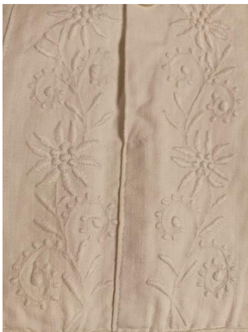
Fotografia 1. Zdobienie koszuli męskiej haftem płaskim - motyw szarotek, gałązek i listków, koszula z archiwum autora tekstu, twórca nieznany, lata 70. XX w.

także na bawelnie, etaminie i innych półsyntetycznych i syntetycznych tkaninach, z których współcześnie szyje się kobiece koszule i fartuchy czyli halki noszone pod spódnicą. Haft ten wykonywano najpierw ręcznie, a od początku XX w. także techniką maszynową. Ręczne haftowanie polegało na zaznaczeniu na tkaninie nitką motywu zdobniczego – czyli owalnych lub okrągłych konturów listków czy kwiatków, tak by później za pomocą drewnianego szydła odpowiednio rozepchać osnowę tkaniny. By wzór był trwały brzeg każdej dziurki