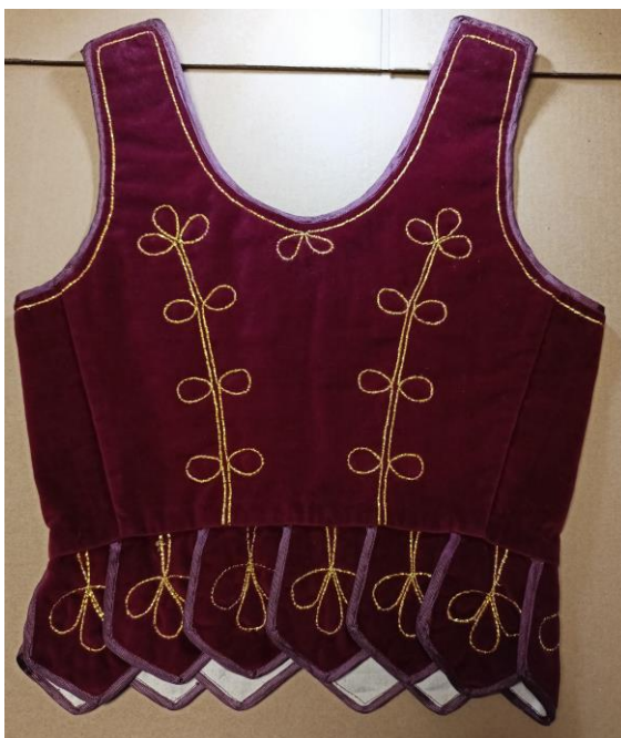
Fotografia 34 i 35. Prząd i tył bordowego gorsetu z aksamitu ozdobionego motywami pętlcowymi. Sznurek w złotym kolorze naszyty z przodu gorsetu w formie tzw. ósemek. Tył gorsetu ozdobiony motywem dwóch gałązek z listkami w formie pętelek. Kaletki ozdobione potrójną pętlami i obszyte pasmanterią. Gorset wykonany w 1967 r. przez Helenę Fatlę z Kościelisk E/6060/MT.