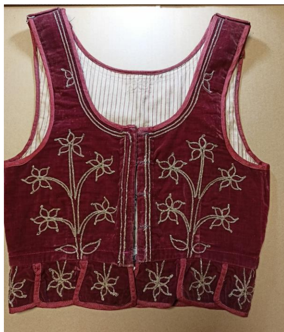
Fotografia 36. Tył gorsetu w kolorze bordo wykonany około 1900 r. ozdobiony beżowym sutaszem w motywy gałązek ze stylizowanymi kwiatami ostu E/7797/MT.