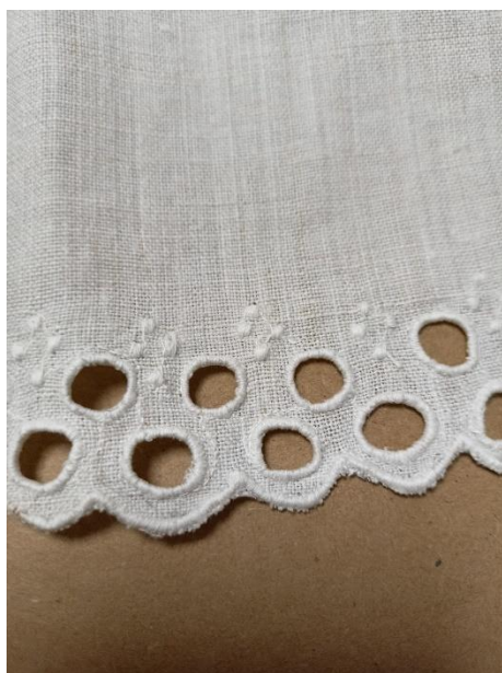
Fotografia 2. Detal fartucha z wsi Ciche wykonanego w 1957 r. E/5191/MT - podwójny rząd dziurek oraz wykonane ściegiem płaskim kropki.

obszywano nitką (fot. 2). Haft ten wykonywany ręcznie był bardzo czasochłonny i wymagał dużych umiejętności manualnych, a przez to był drogi (fot. 3).