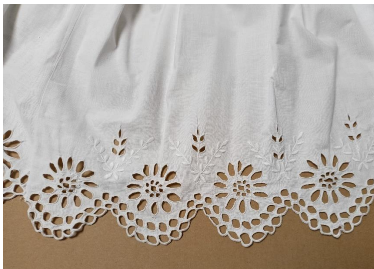
Fotografia 5. Wykończenie fartucha zakładanego pod spódnicę haftem angielskim. Fartuch z Olczy k. Zakopanego wykonany w około 1900 r. E/5911/MT. Tkanina wycięta w zęby, ozdobiona podwójnym rzędem dziurek wzdłuż wycięcia, centralnym motywem jest wzór kwiatu szarotki, a całości haftu dopełniają wycięte bądź wyhaftowane gałązki i listki.

U mniej zamożnych kobiet i dziewcząt zastępowano go poprzez doszywanie do niezdobionych koszul tańszych, siateczek, fabrycznych falbanek lub koronek szydełkowych (fot. 4). Gdy pojawiła się możliwość wykonywania tego typu haftu przy pomocy maszyn do szycia typu Singer, hafty te stały się nieodłącznym elementem stroju góralek podhalańskich (fot. 5).