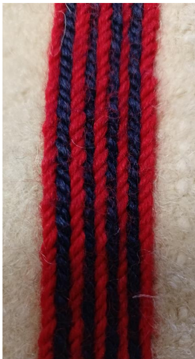
Fotografia 12. Lampas z dziewięciu sznurów w kolorach czerwonym i granatowym. Jednolite kolorystycznie sznury naprzemiennie skręcane w liczbie nieparzystej, maskujące szwy zewnętrzne spodni góralskich. E/451a/MT.