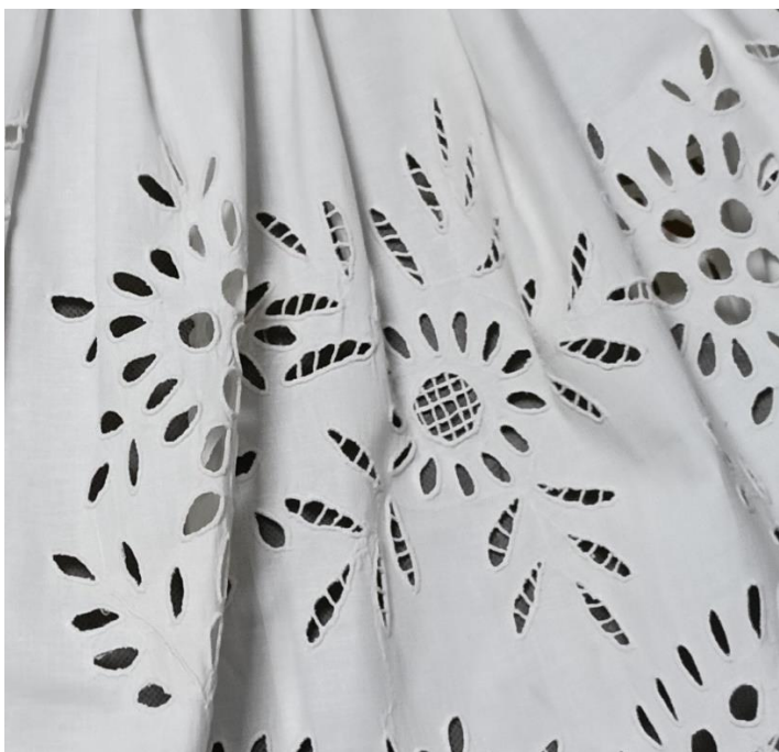
Fotografia 6. Motyw bukietu kwiatów i kwiatu dziewięciornika wykonany haftem angielskim na fartuchu kobiecym z Ratułowa z ok. 1900 r. E/1069/MT.