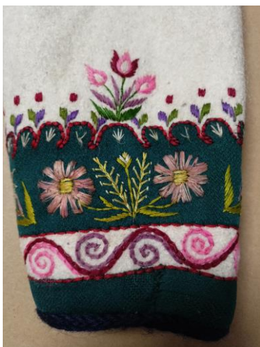
Fotografia 23. Brzeg rękawa białej cuchy wykończony aplikacją z zielonego sukna wyciętą w zęby oraz motywem woluty czyli tzw. „gadzika” i motywami roślinnymi stokrotek, listków i lili złotogłów E/3096/MT.