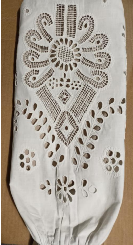
Fotografia 10. Rękaw koszuli kobiecej z motywem hafciarskim parzenicy, który to motyw został przeniesiony na koszule z męskich portek i stał się popularny w II połowie XX w. Koszula ze zbiorów autora tekstu lata 70. XX w. twórca nieznan.

zaadaptowany na Podhalu z wzorników tkanin drukowanych, niezwykle popularnym w krajach karpackich w II poł. XIX w. Często z dziurek wykonywano także romby (fot. 8) oraz przeniesione z męskich portek motywy parzenic (fot. 10). Najczęściej brzeg dekorowanej części stroju kobiecego – mankiet, kołnierzyk lub spód halki wykończony był poprzez wycięcie tkaniny w zęby, które po brzegu ozdabiano galonem z dziurek.