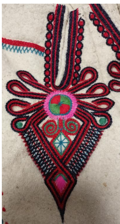
Fotografia 17. Parzenica na portkach z motywem centralnym - kółkiem podzielonym na czerwone i zielone pola tzw. "4 światy". Parzenica dodatkowo ozdobiona ścięciem podwójnej krokiewki na zewnątrz „krzesiwka” oraz motywem wolutowym wewnątrz. Wokół obszycia przyporów dodatkowo wyhaftowany łańcuszek z czerwonym wypełnieniem. Portki z Dzianisza z 1935 r. wykonane przez Łukasza Trojana.