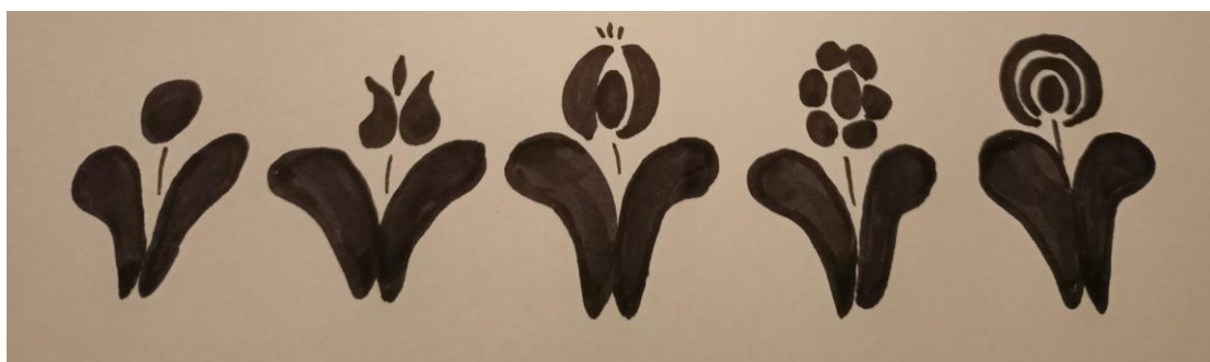
Rysunek 2. Różne motywy roślinne haftowane na serdakach i kożuchach podhalańskich: tzw. bulki (na serdakach męskich) lilie, lilie złotogłów, stokrotki, pawie oko (na serdakach kobiecych).

pomocy kolorowej muliny . Motywy hafciarskie w przypadku okryć męskich stanowiły dwukolorowe liski w kolorach zielonym i niebieskim oraz kwiatek w postaci czerwonego kółeczka , a w przypadku serdaków lub kożuchów kobiecych dekoracje te przyjmowały formy konkretnych kwiatów: lilii, lilii złotogłów, różyczek, stokrotek lub pawich oczek (rys. 2). Dodatkowe zdobienia serdaków tworzyły pojedyncze aplikacje z safianowej skórki i hafty na plecach na wysokości łopatek i bioder tzw. cebule (fot. 32). W XIX w. serdaki męskie szyte po południowej stronie Tatr lub kopiowane wg tamtej mody na terenie Podhala miały zahaftowane niemal całe plecy motywami dużych bukietów kwiatów (fot. 31), które jednak z czasem zarzucono na Podhalu.