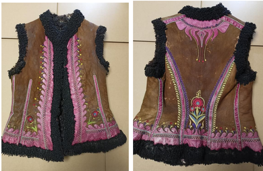
Fotografia 28-29. Serdak kobiety z 1907 r. wykonał Franciszek Gąsienica. E/4922/MT przód/tył. Na serdaku widać baranek wokół serdaka i wycięć na ręce. Serdak ozdobiony skórą safianową w kolorze malinowym oraz haftami w motywy roślinne: listki i kwiaty.

W latach 60. i 70. XIX w. przyszła na Podhale moda z Liptowa na krótkie kożuchy i serdaki słowackie zwane tam węgierskimi – farbowane na różne odcienie brązów, oranżów i zieleni, zdobione rozbudowaną aplikacją z safianowych skórek, kolorowym haftem i wykończano czarną oprymą , czyli barankiem, sięgające do wysokości bioder lub nieco poniżej. Ów baranek okalał serdaki i kożuchy wokół połów od spodu i wokół szyi. Pierwotnie doszywany naturalny baranek cakli podhalańskich w kolorze czarnym, został w XX wieku zastąpiony czarnym obszyciem karakułów. Różnice między skórzanymi okryciami kobiet i mężczyzn najłatwiej rozpoznać po obszyciach wokół otworów na ręce. Serdaki męskie są w tym miejscu obszyte safianową skórą, a serdaki kobiece oprymą z baranka (fot. 28-31).