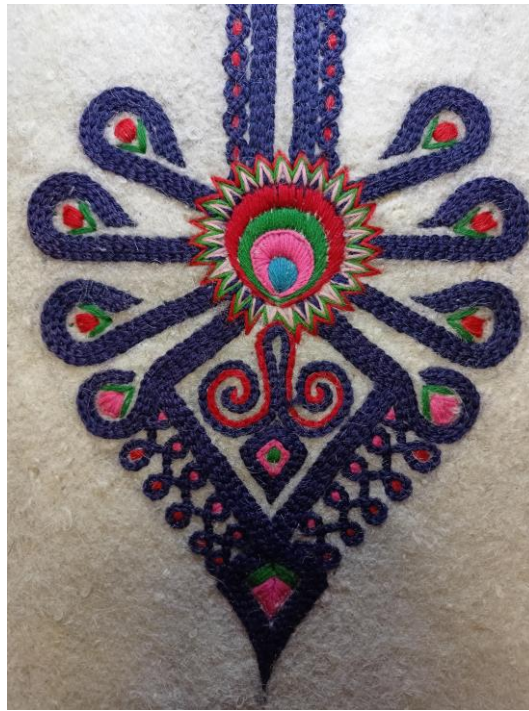
Fotografia 20. Parzenica z motywem centralnym w formie pawiego oka w kolorach czerwonym, zielonym różowym i niebieskim. Kontur parzenicy wykonany ścięciem łańcuszkowym w kolorze granatowym. Motyw krzesiwka wypełniony ornamentem wolutowym a na zewnątrz motywem tzw. ósemek. W górnej części wokół obszyca przyporu motyw łańcuszka z czerwonym wypełnieniem. Parzenicę jako wzornik wykonał Wojciech Wyroba z Ratułowa w 1934 r. E/4470/MT.

Warto dodać, że apogeum zdobnictwa góralskich portek osiągnięto w latach trzydziestych XX w. kiedy to dobra koniunktura gospodarcza Podhala spowodowana rozwojem turystyki dawała takie możliwości finansowe, że najzamożniejsi górale, zwłaszcza ci z okolic Zakopanego, zlecali haftowanie portek takimi parzenicami, na które składały się misterne zdobienia geometryczne i roślinne wykonywane nawet z szesnastu kolorów wełny. Ów motyw zdobniczy został tak rozbudowany że zajmował całą przednią górną część portek i sięgał niemal do wysokości kolan (fot. 21).