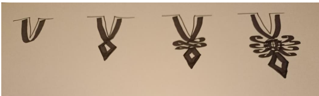
Rysunek 1. Ewolucja parzenicy góralskiej: a - obszycie przyporu sznurem, b - obszycie wzbogacone motywem rombu "krzesiwka", c - dodanie ornamentów pętlicowych między obszyciem a krzesiwką, d - powyżej "krzesiwka" motyw centralny tzw. „świat”, a koło niego niepełne pętlice czyli tzw. kule.