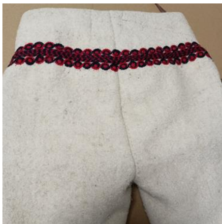
Fotografia 11. Ozdobny lampas z tylnej części portek góralskich wykonany z wełnianych sznurków w kolorach czerwonym i granatowym E/293/MT portki z Dzianisza z 1935 r.

16). Gdy rozmiar tej dekoracji był większy - do kilku centymetrów średnicy, koliste motywy wewnętrzny ozdabiano dzieląc je na cztery pola czyli na „ stiry światy ” (fot. 17) lub poprzez wpisanie weń takich ozdób jak: rozeta (fot. 18), gwiazda lub kwiat (fot. 19, 21) czy modne w pierwszych dekadach XX wieku motywy krakowskie takie jak. pawie oko (fot. 20).