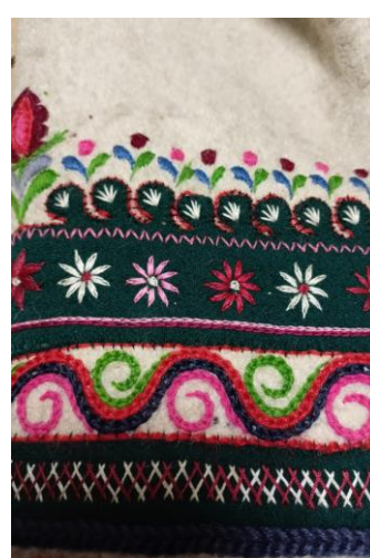
Fotografia 25. Brzeg rękawa cuchy białej ozdobiony aplikacją z zielonego sukna oraz haftem krzyżykowym tzw. „krokiewką” lub inaczej „ściegiem zakopiańskim”, motywem gadzika wykonanym ściegiem tańczuskowym oraz haftem płaskim, którym wykonane są kwiatki „pazdurki” i listki. E/293/MT.