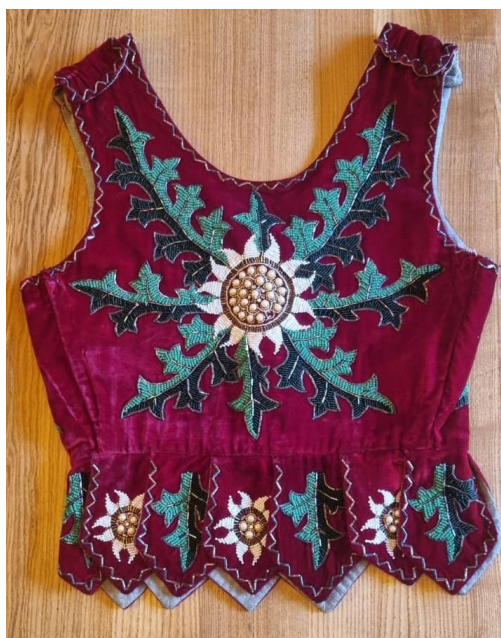
Fotografia 39. Gorset paniński z czerwonego aksamitu ozdobiony motywem dziewięciornika wykonanym koralikami i cekinami. Gorset wykonany w latach 60. XX w. Pochodzi z archiwum rodziny autora tekstu. Twórca nieznanym.