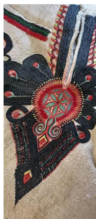
Fotografia 18. Parzenica z motywem centralnym w kształcie rozety w kolorach czerwonym i zielonym. Grube kontury parzenicy wykonane ścięciem łańcuszkowym w kolorze czarnym. Obszycie przyporu ozdobione dodatkowo motywem gadzika i listków w kolorach czerwonym, czarnym i zielonym. Portki wykonał Michał Łuczek z Ratułowa w 1934 r. E/4510/MT.