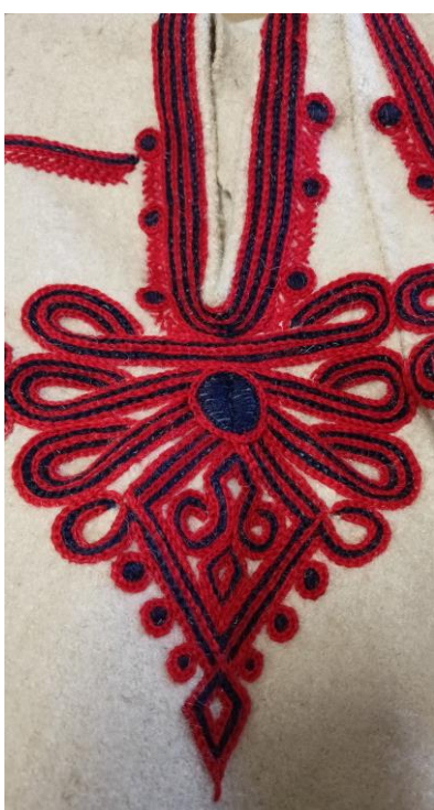
Fotografia 16. Parzenica na portkach wykonana ścięciem łańcuszkowym. Z dominacją koloru czerwonego. Motyw centralny oraz obszycia wokół przyporu i wokół krzesiwka ozdobione dodatkowymi czarnymi kóteczkami tzw. bulkami. E/4518/MT. Portki wykonane przez Stanisława Fatłę z Kościelisk w 1934 r.