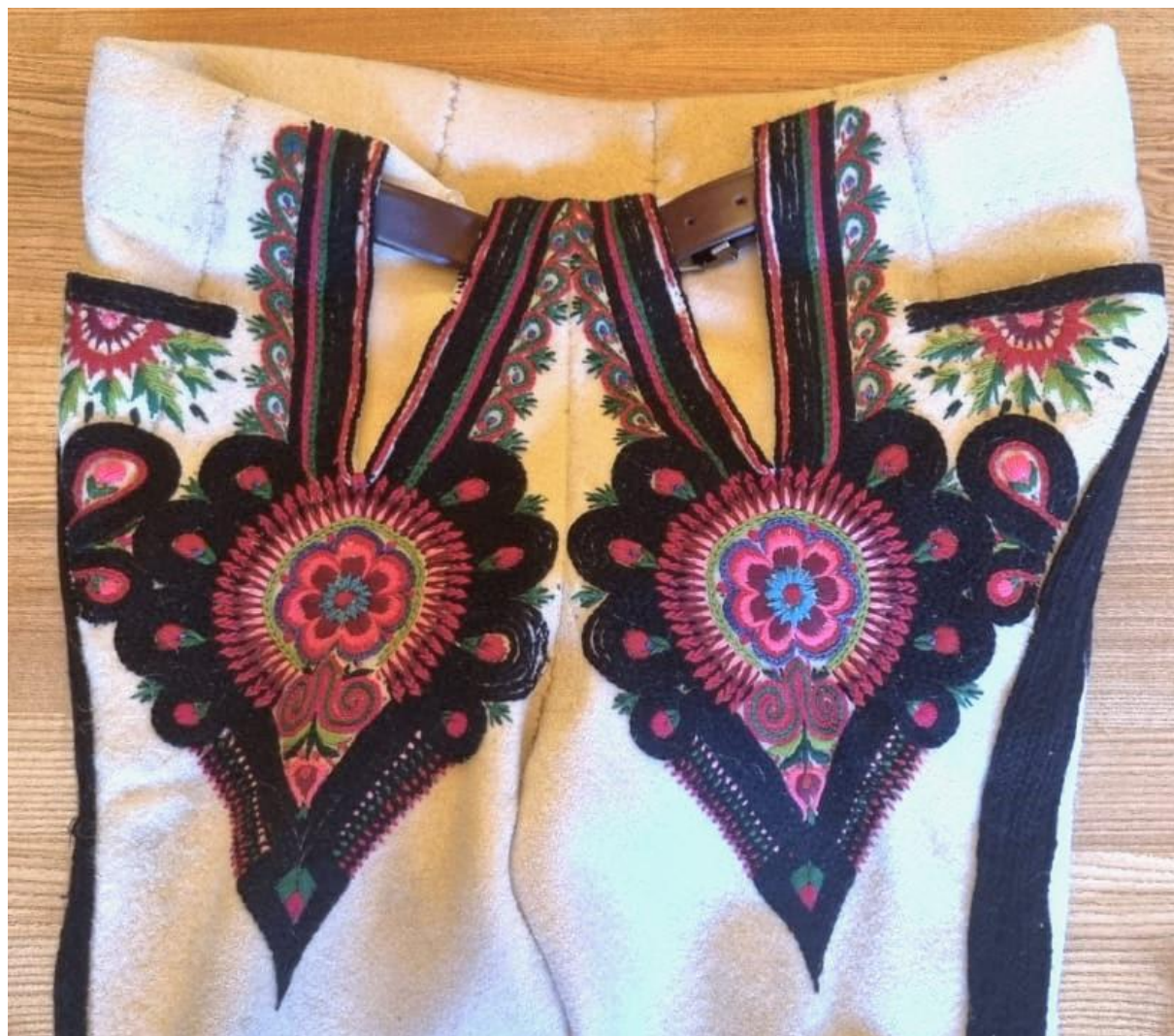
Fotografia 21. Portki góralskie z bogato zdobionymi parzenicami w których poza klasycznym konturem parzenicy w kolorze czarnym występują poniżej kieszeni motywy roślinne dziewięciśliu, motywy gałązki igliwia wokół rozcięcia przyporów oraz rozbudowana w kształcie i kolorze dekoracja centralna o motywie kwiatu róży. Tego typu parzenice były popularne w stroju góralskim w latach trzydziestych XX w. oraz po II wojnie światowej. Portki pochodzą z archiwum rodziny autora tekstu i zostały wykonane w latach 60. XX Twórca portek nieznan.

utrzymały się w stroju odświętnym przez niemal cały wiek XX. do klasycznej parzenicy dodawano wówczas motywy dziewięciśliu, szyszek, lub gałązek świerku. Zaś motyw centralny przybrała kształt wielokolorowej róży okolonej innymi drobniejszymi kwiatkami. Obecnie wraca się do skromniejszych haftów na portkach góralskich, wykonując hafty zwyczajowo w trzech podstawowych kolorach: czarnym, czerwonym i zielonym. Czasami dodając nieznaczne ilości włóczki w kolorach różowym i niebieskim.