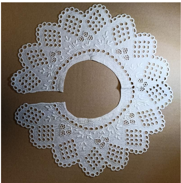
Fotografia 8. Motyw rombów i bukietów kwiatów na kołnierzu koszuli góralskiej z Działisza z 1932 r. E/4452/MT