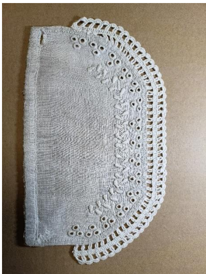
Fotografia 4. Mankiet rękawa koszuli kobiecej z Brzegów z 1953 r. E/3130/MT - mankiet ozdobiony haftem angielskim w formie dziurek oraz wyszytą haftem płaskim gałązką z listkami. Po brzegu mankietu doszyta koronka szydełkowa.