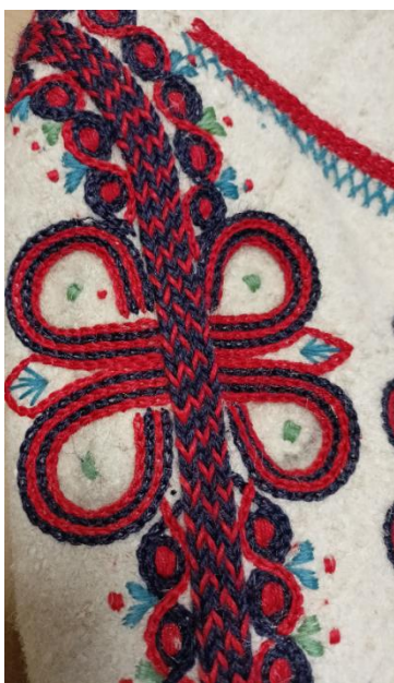
Fotografia 14. "Pieski", „kohuty” lub "raki" - ozdobne hafty z zewnętrznej strony nogawki, koło lampasu nieco poniżej linii bioder, E/293/MT.