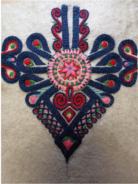
Fotografia 19. Parzenica z motywem centralnym w formie gwiazdy lub kwiatu, wykonana w kolorach granatowym - kontur parzenicy oraz czerwonym, zielonym i różowym. Po zewnętrznej stronie krzesiwka zdobienia w formie ósemek z wypełnieniem z kolorowej wełny, a wewnątrz i u góry wokół przyporu motywem wolutowym. Parzenicę jako wzornik wykonał Wojciech Wyroba z Ratułowa w 1934 r. E/4522/MT.