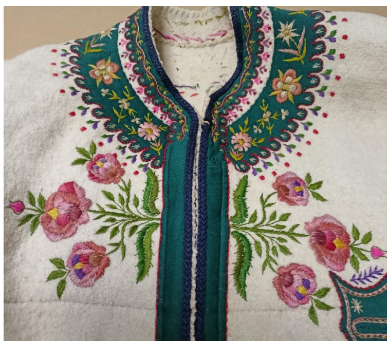
Fotografia 27. Cucha z białego sukna ozdobiona haftowanymi bukietami róż. E/3096/MT z 1949 r. wykonana w miejscowości Zub-Suche.