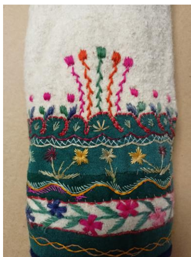
Fotografia 24. Brzeg rękawa białej cuchy wykończony aplikacją z zielonego sukna wyciętą zęby oraz haftami tańczuszka, gadzika i motywami roślinnymi bukietów kwiatów. Powyżej aplikacji haft ściegiem krzyżykowym. E/4908/MT.