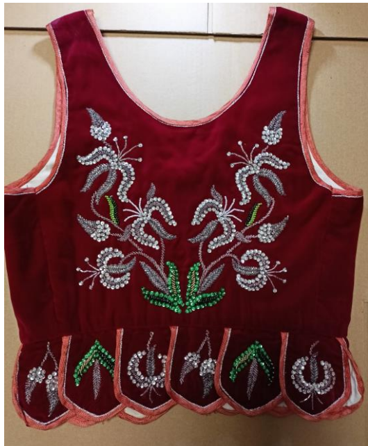
Fotografia 38. Gorset z czerwonego aksamitu ozdobiony motywem lilii złotogłów. Dekoracja wykonana z różnych rodzajów srebrnych i zielonych cekinów i koralików. Wykonany w miejscowości Ciche w 1940 r. E/10228/MT.

Moda na gorsety zdobione koralikami i cekinami rozpoczęła się na początku XX w. Wówczas błyszczącymi dodatkami pokrywano, centralne części dwóch przodków i tyłu gorsetu oraz wszystkie kaletki. Stosowanie tego typu ozdób spowodowało, że na gorsetach pojawiły się różnorakie motywy roślinne bazujące na konkretnych gatunkach kwiatów głównie związanych z naturalnym środowiskiem Podhala takich jak np. lilia złotogłów (fot. 38), szarotka, mak, oset, oraz dziewięcślil , który jako motyw zdobniczy ma szczególne znaczenie bowiem uważany jest za najbardziej znany motyw zdobniczy kobiecego stroju góralskiego, który w środowisku góralskim wyhaftowany na czerwonym tle z białych, srebrnych i zielonych cekinów i koralików , jest tradycyjnie przypisany dla kobiet niezamężnych. Inne motywy roślinne występujące na gorsetach haftowanych cekinami i koralikami to zapożyczone z czasów Młodej Polski popularne wówczas kompozycje kwiatów ogrodowych, takich jak: bratki, stokrotki, róże itp. Wpływ na zdobnictwo gorsetów koralikami i cekinami miały migracje do ościennych krajów oraz do Stanów Zjednoczonych, skąd przysyłano na Podhale kolorowe okrągłe oraz podłużne koraliki, a także okrągłe błyszczące cekiny oraz aksamity i welury. W II połowie XX w. oprócz gorsetów szyto na Podhalu z aksamitów także spódnice, które jako dopełnienie danego gorsetu, były dekorowane tym samym motywem zdobniczym.