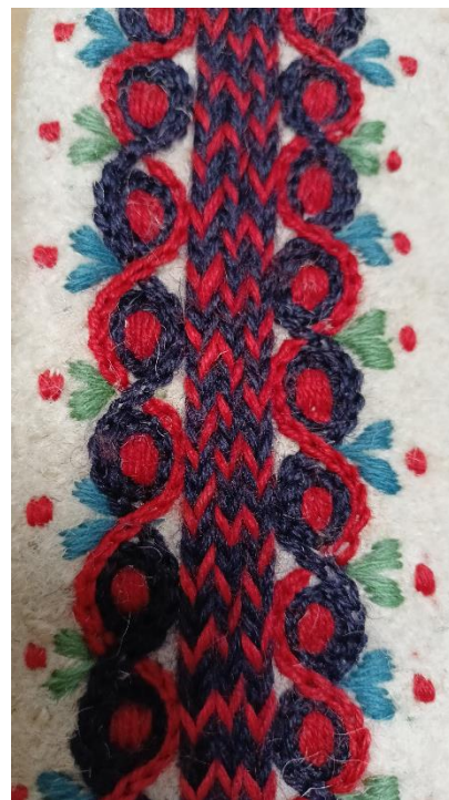
Fotografia 13. Lampas wykonany z sześciu ułożonych naprzemiennie sznurów skręcanych z czerwonej i granatowej wełny w taki sposób by otrzymać efekt warkocza. Lampas dodatkowo został przyozdobiony przecinającymi się haftami w formie linii falistych zwanych na Podhalu gadzikami, wykonanymi ścięciem łańcuszkowym. Po zewnętrznej stronie dodane ozdoby w formie zielonych i niebieskich listków i pączków tzw. bulek. E/293/MT.